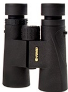
Leader 10x42 SE